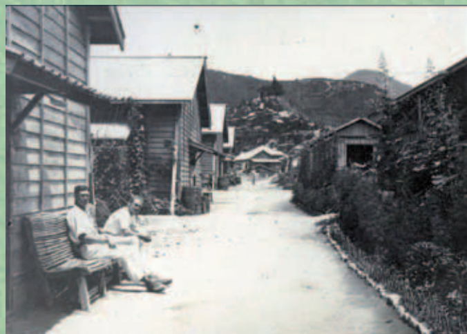
Archivfoto der Lagerstraße mit Baracken