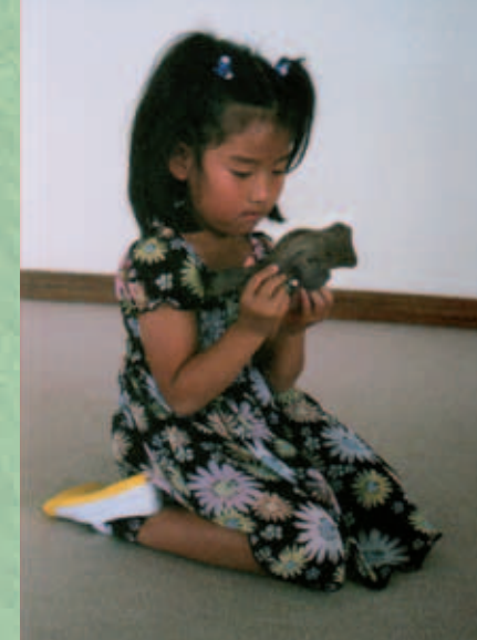
Rätselhaftes Spielzeug – gefertigt von einem der Kriegsgefangenen

Die täglichen Übungen der Gefangenen wie Sport an Geräten, Schnitzen, Schreiben, Musizieren, Zeichnen, Bauen, Kochen etc. ergaben ein verlässliches Gerüst und im Ergebnis Befriedigung. Die Intensität der Ergebnisse – diese materialisierten Sehnsüchte – hat die Japaner fasziniert, und sie haben auf der Stelle begonnen, das Geräteturnen, das Spielen europäischer Musikinstrumente, das Brotbacken und vieles mehr zu erlernen und in ihre eigene Kultur einzubinden. Bald erwachte auch das Interesse der Deutschen an japanischem Handwerk und japanischer Kunst. Gegenseitige Hilfe und steter Austausch wurden zur täglichen