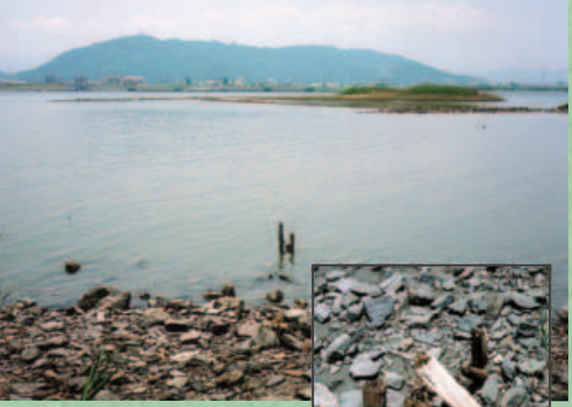
Reste der Holzbrücke heute