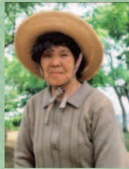
Diese in der Nachbarschaft lebende alte Dame pflegt das Lagergelände