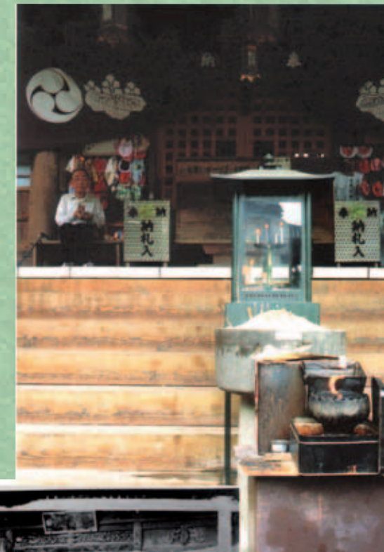
Auf den Stufen des Ryozen-Tempels (Ryozenshi)