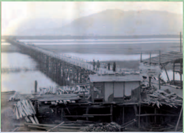
Deutsche Kriegsgefangene auf der Holzbrücke über den Yoshinogawa-Fluss (Archivfoto)