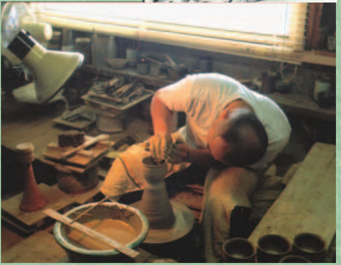
Die Töpferei Otani-Naruto gestern und heute