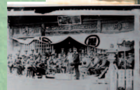
Archivfoto: Das Engel-Orchester auf den Stufen des Ryozen-Tempels (Ryozenshi)