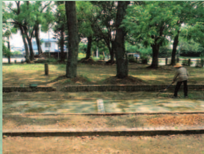
Die Grundmauern einer Lagerbaracke heute